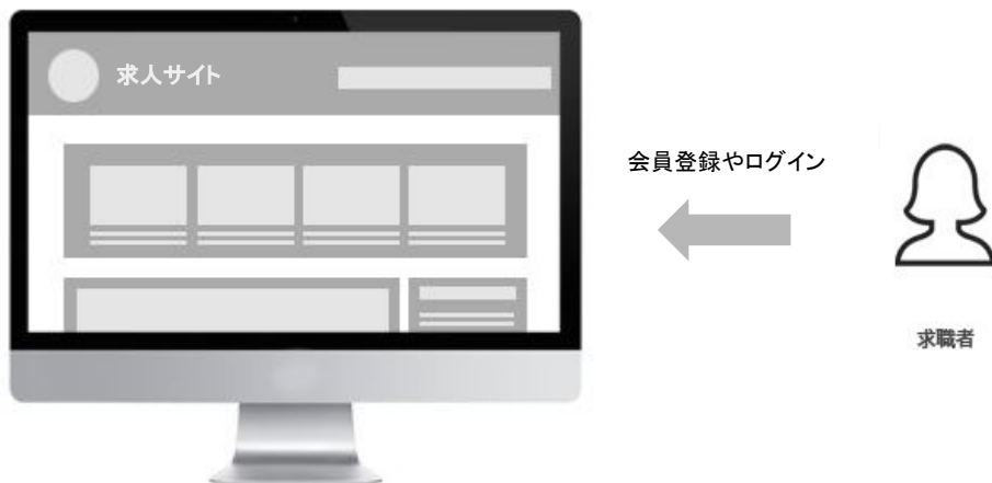
パレットCMSで作成した求人サイト

また、USERモジュールとENTRYモジュールを組み合わせる事で、求人応募時に会員情報を参照して応募することもできるようになります。