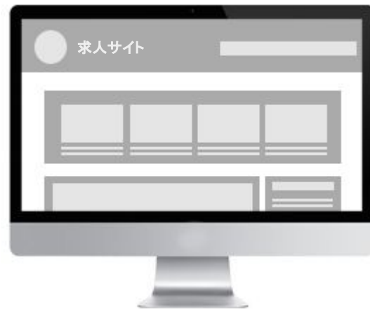
会員登録やログインフォームが利用できる