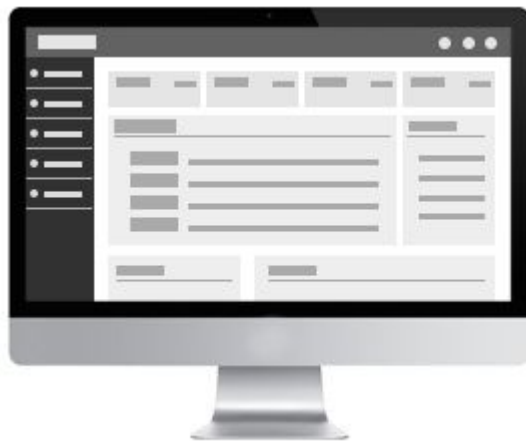
パレットCMSの管理画面